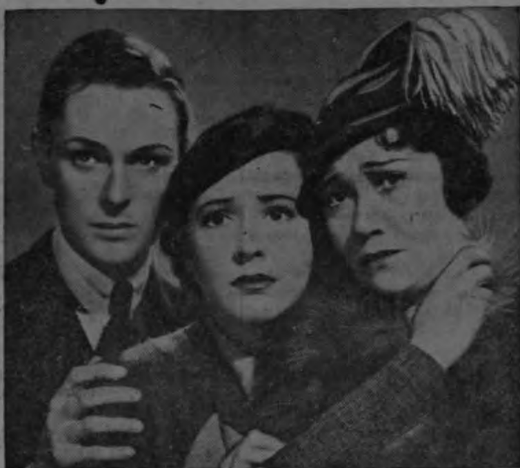
Eddie Nugent, Mae Clarke, Fay Bainter in "This Side of Heaven"

El drama familiar, el dolor de muchos padres, la tragedia de muchos hogares EN LA PENDIENTE, por Lionel Barrymore, Hoy en el Variedades